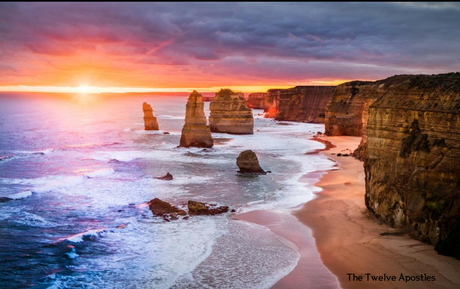
The Twelve Apostles